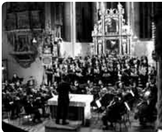
Camerata Instrumentale Berlin gemeinsam mit der Helmstedter Bachkantorei.

terkomponist ein Begriff, die Ouverture zu seiner Operette „Leichte Kavallerie“ ist in vielfältigen Bearbeitungen ein Hit des Konzertrepertoires. Nichtsdestotrotz existiert von ihm ein Requiem für Soli, Chor und Orchester, das im Umfeld nach Mozart seinesgleichen sucht. Wirkungsvolle Chöre, differenzierte Orchesterfarben und eindringliche Solopartien ziehen die Zuhörer unmittelbar in ihren Bann. Dazu Spezialitäten wie die Besetzung eines Tam-Tams im Orchester oder ein Trauermarsch als Passacaglia im 5/4-Takt: Unbedingt Literatur für die „Hall of fame“ der Kirchenmusik!